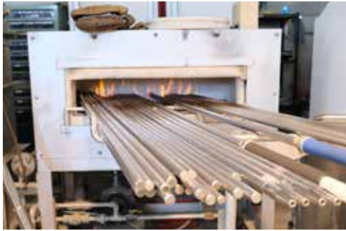
パイプフォーマー