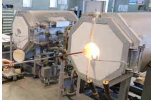
グローリーホール (両口)