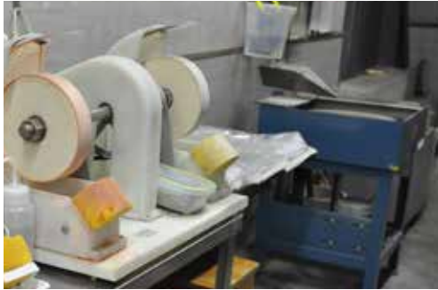
平盤研磨機 / パミス