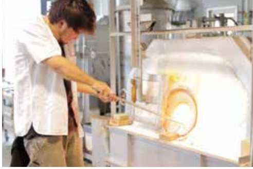
熔解炉 (オープンポット 80 kg)