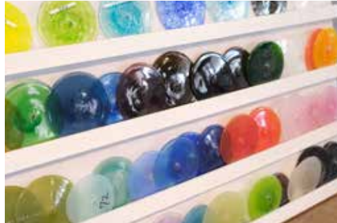
色ガラス (別料金) 透明ガラス (2 kg以上は 1 kg 800 円)